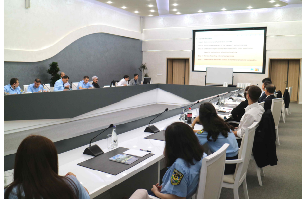
<진종호 세무주사 강의>