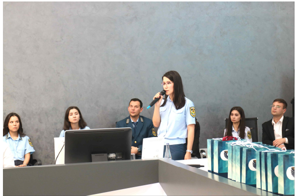
<참가자 대표 소감>