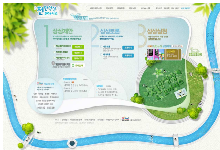
< 기존 >