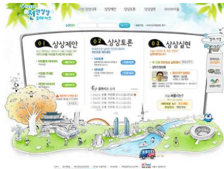
< 변경 >